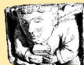
DOM RÉMI CARRÉ