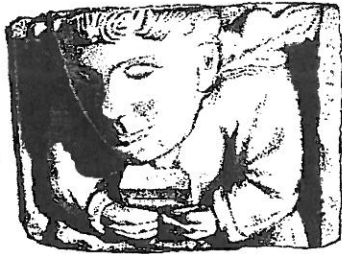
DOM RÉMI CARRÉ